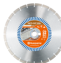
TACTI-CUT S50 PLUS