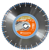
ELITE-CUT S50 (power cutters)