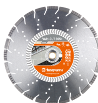
VARI-CUT S65 (mototroncatrici manuali)