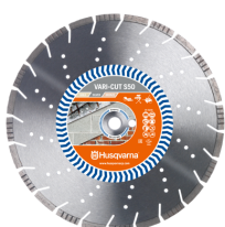
VARI-CUT S50 (mototroncatrici manuali)